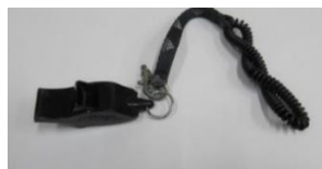
黒色のホイッスル