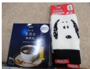
コーヒーとアームウォーマー