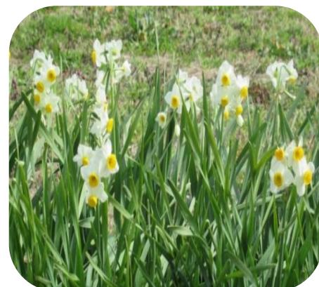
コミュニティセンター前の すいせんがきれいに咲いてました。